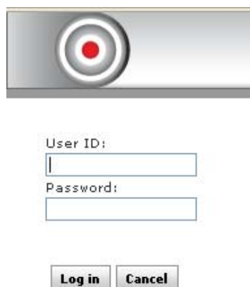
Slika 1. Pristup aplikaciji

Nakon što se u pregledniku unese adresa za pristup prikazat će se sljedeći ekran (koji će jezik biti korišten za prikaz stranice za prijavu korisnika ovisi o lokalnim postavkama računala i pripadnog web preglednika):