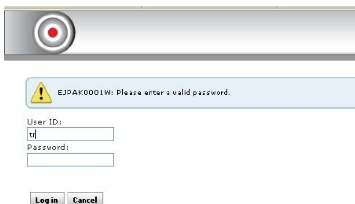
Slika 2. Krivo uneseni podaci

Na prikazanom ekranu potrebno je unijeti korisničko ime i lozinku dobivenu od dražbenog ureda, te pritiskom na tipku „Login“ pristupiti aplikaciji. Ukoliko ste nešto krivo unijeli prikazati će se: